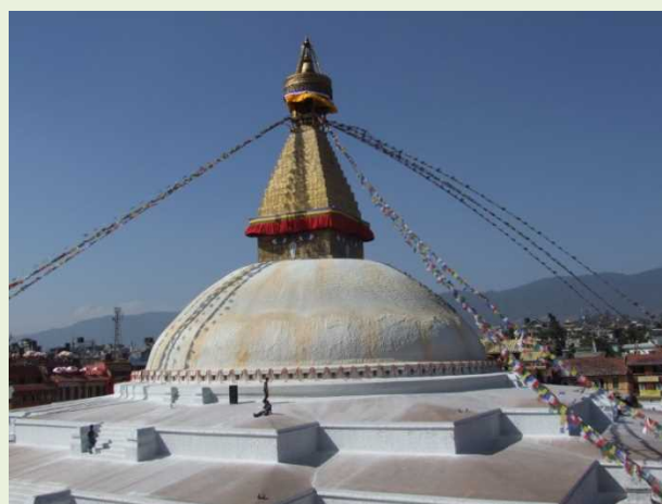
ボータ・ナート(カトマンズ)