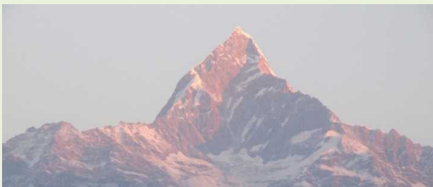
ポカラから見えるマチャプチャレ