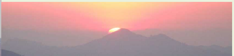
ヒマラヤの日の出 (天候により見られない場合があります)